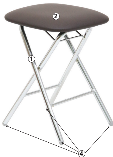
СХЕМА СБОРКИ СТУЛА «ЭКСТРА СКЛАДНОЙ»