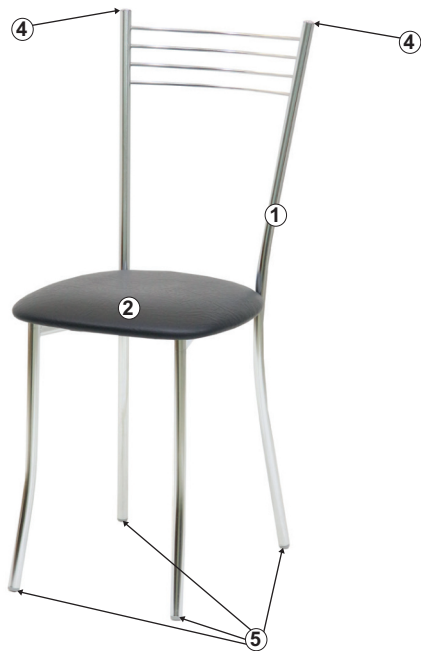
СХЕМА СБОРКИ СТУЛА «ХЛОЯ», «ХЛОЯ МДФ»