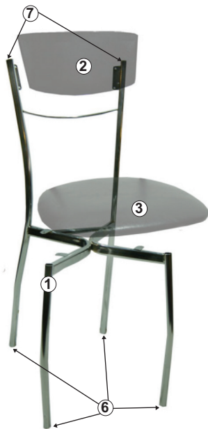
СХЕМА СБОРКИ СТУЛА «СИЛЬВИЯ»