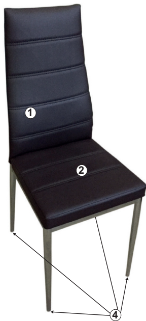
СХЕМА СБОРКИ СТУЛА «НОРД»