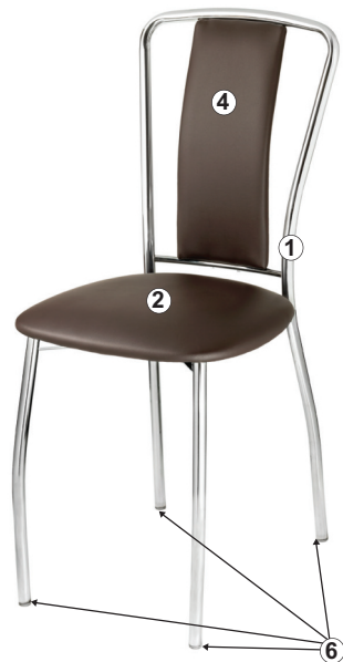
СХЕМА СБОРКИ СТУЛА «ЛИЛИЯ-М»