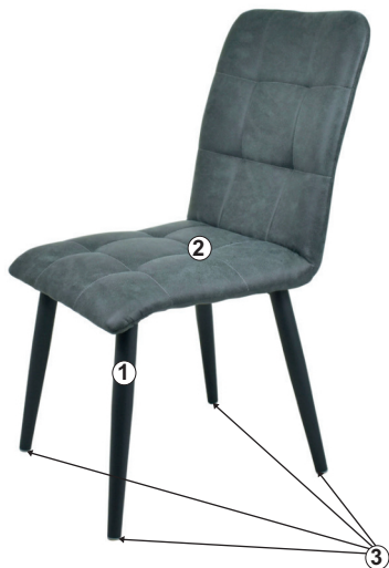
СХЕМА СБОРКИ СТУЛА «КОМО»