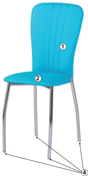
СХЕМА СБОРКИ СТУЛА «СИЕНА»